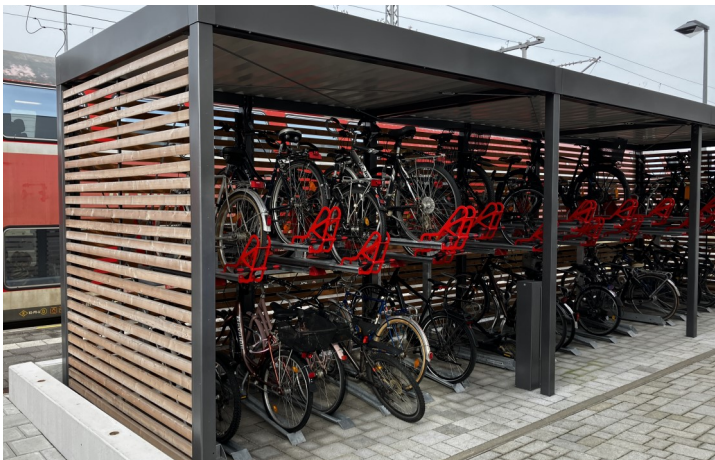
ADFC-zertifizierte Radabstellanlage mit über 700 wettergeschützten Stellplätzen am Bahnhof Buchloe

Weitere Vorteile und die Konditionen können im Internet über: https://www.adfc.de/sei-dabei/adfc-mitgliedschaft-vorteile/ abgefragt werden.