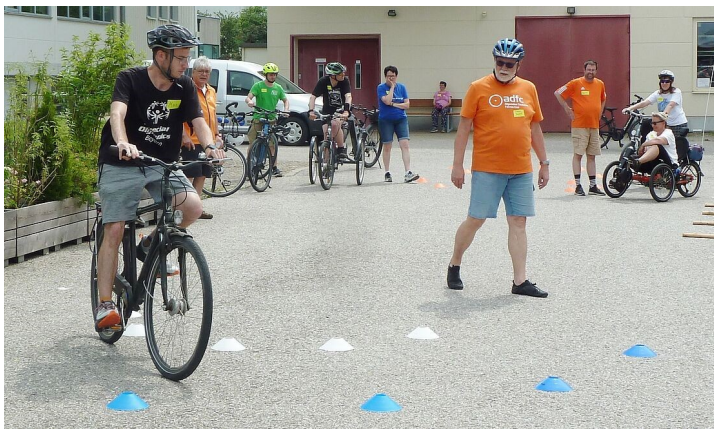
Fahrsicherheitstraining mit der Lebenshilfe Ostallgäu-Kaufbeuren

Sehr gefragt sind auch unsere Reparatur- und Pannenkurse sowie Workshops zur Fahrradnavigation mit Komoot.