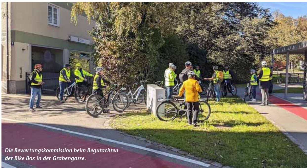
Die Bewertungskommission beim Begutachten der Bike Box in der Grabengasse.