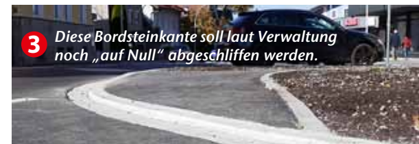
3 Diese Bordsteinkante soll laut Verwaltung noch „auf Null“ abgeschliffen werden.