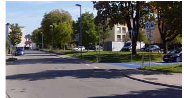
Die Madlenerstraße wird zur zweiten Fahrradstraße in Kempten. Text: Tobias Heilig

Der ADFC begrüßt auch den Einbau der elektrisch versenkbaren Poller. Außer der Durchsetzung des bereits bestehenden nächtlichen Durchfahrtsverbots ändert sich zwar durch die elektrisch versenkbaren Poller vorerst nichts, aber es wird somit auch eine Option für zukünftige weitere Sperrungen geschaffen. Diese könnten dann, wenn die Poller erst einmal installiert sind, sehr einfach beschlossen und realisiert werden.