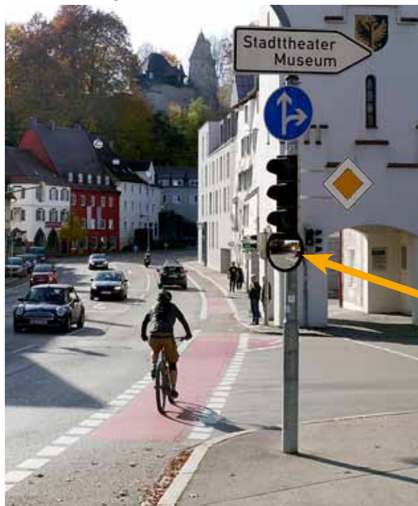
Spiegel für Rechtsabbieger an der Kreuzung Burgstraße/Illerstraße in Fahrtrichtung stadteinwärts.

Die Stadtverwaltung hat an mehreren Kreuzungen in Kempten Spiegel an Ampeln als Abbiegehilfe montieren lassen. Damit sollen insbesondere Busse und Lkw beim Rechtsabbiegen besser in der Lage sein, geradeaus fahrende Radler und Fußgänger zu erkennen, die sich vielleicht gerade im toten Winkel befinden.