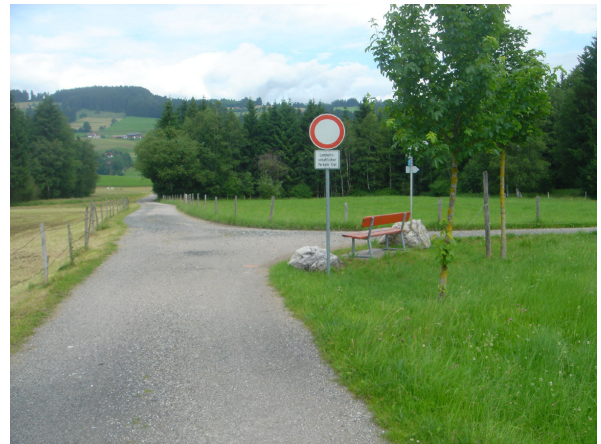
Bisherige Verkehrsordnung Zeichen 250

die Radrouten Bodensee-Königssee-Radweg sowie Radrunde Allgäu könnte man auf diese Strecke legen. Radwanderer müssen nicht mehr über die schmale OA6 fahren. Auch die Tourismusregion „Alpsee-Grünten“ bewirbt diese Strecke in ihrem Radtourenbüchle auf Seite 24.