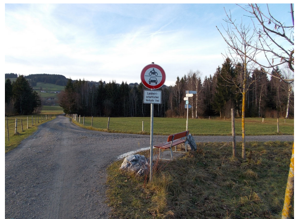
Neu seit November 2016: Zeichen 260